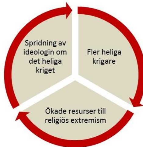
Det heliga krigets destruktiva spiral

Stora delar av världen plågas av våld, krig och terror som har sin grund i ett religiöst motiverat hat mot alla som inte tillhör den egna gruppen. Idag är det militanta islamister som står i fokus men samma enkla samband gäller för alla ideologiskt styrda grupper. Grunden är en övertygande ideologi som kan skapa hängivna kämpar och genom att man får en stor tillströmning av trogna anhängare ökar också rörelsens tillgängliga resurser i form av till exempel pengar, vapen, arbetskraft och kunskap. Genom de ökande resurserna kan man föra ut ideologin på ett ännu mer övertygande sätt och därmed attrahera ännu fler hängivna kämpar och få tillgång till ännu mer resurser osv.