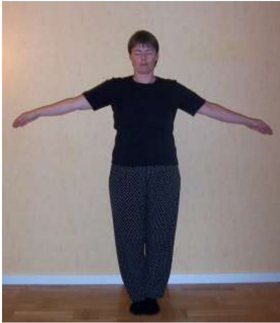
Lyft upp Qi, sektion 3.