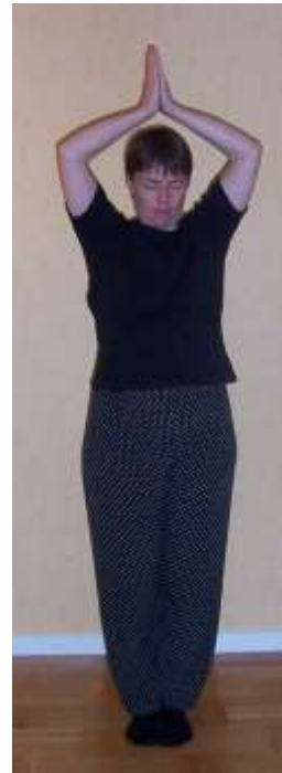
Lyft upp Qi, sektion 5.