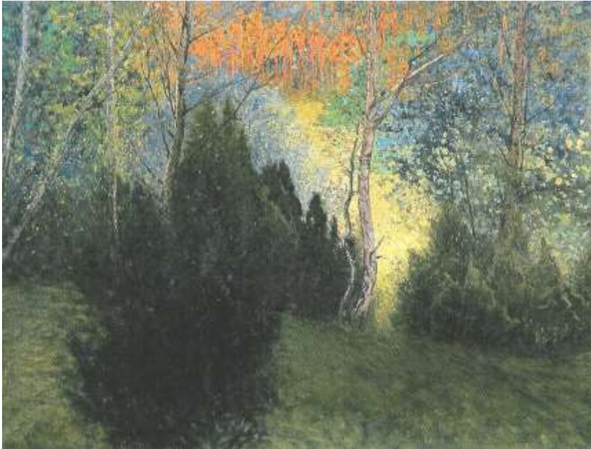
Hilma af Klint, Aftonfrid 1907

Ett annat exempel finns i Hilma af Klints målning Aftonfrid som jag en dag sommaren 2003 upptäckte föreställde utsikten från mitt arbetsrum vid just det ögonblicket.