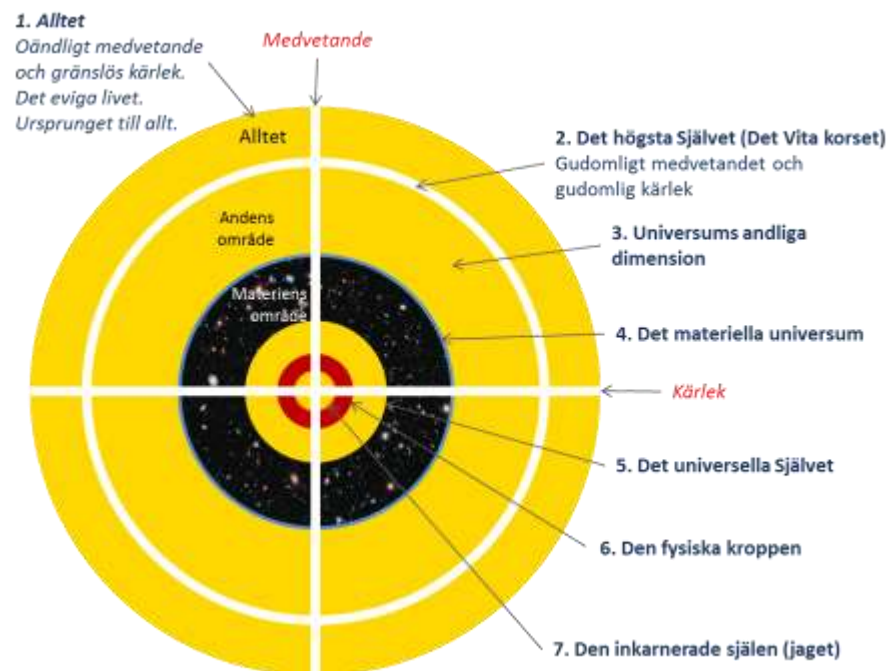
Utvecklingen från Alltet till den inkarnerade själen

Det projekt som jag beskriver är en del av ett stort projekt som i grunden handlar om sambandet mellan den mänskliga själen, det universella Själv, universums materiella dimension, universums andliga dimension och det gudomliga Alltet. Universums andliga dimension är en avläggare av Alltet. Universums materiella dimension växer och utvecklas i sin tur i den andliga dimensionen. När det materiella universum nått en sådan mognad att det kan fungera som en livmoder för anden föds droppar av anden från den andliga dimensionen in i den materiella dimensionen. Dessa droppar utvecklas till ett universellt Själv genom att avläggare i form av en själ gång på gång föds in i en fysisk kropp för att växa och utvecklas. Genom att den mänskliga själen utvecklas bidrar den till utvecklingen av sitt eget universella Själv. När det universella Själv når sin fullbordan i en sista fysisk inkarnation kan det återvända som ett fullkomnat Själv till den andliga dimensionen. Själv blir på så sätt en gåva från vårt universum som bidrar till Alltets tillväxt.