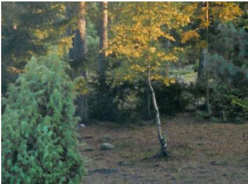
Utsikt från mitt arbetsrumsfönster om aftonen den 12/8 2003