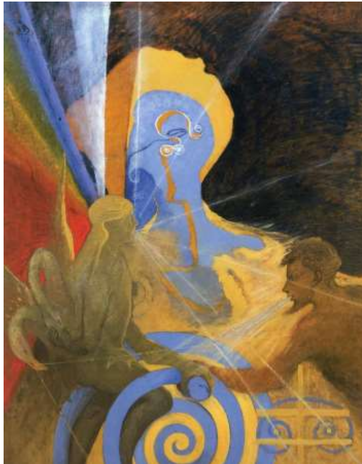
Hilma af Klint, De stora figurmålningarna nr 1